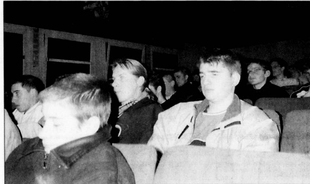
Les lycéens ont bien reçu le message délivré par le groupe Creep AC.

Les statistiques sont éloquentes : 98 % des jeunes écoutent entre deux et trois heures de musique par jour. Parmi eux, 83 % ont déjà été confrontés à des problèmes d'audition. Les quatre Normands du groupe Creep AC, démonstrations à l'appui, ont expliqué aux lycéens les risques de la musique amplifiée.