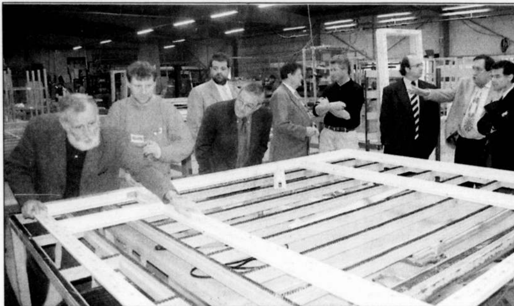
Les élus municipaux ont visité les locaux agrandis de B'Plast, mercredi après-midi.

B'Plast, spécialiste de la menuiserie PVC. De huit salariés en 1989 à 90 aujourd'hui, dont 45 à Vire. Gérant ses fenêtres, ses portes et ses vérandas de la conception à la pose, l'entreprise s'est récemment agrandie et pense déjà à l'avenir. Les élus lui ont rendu visite.